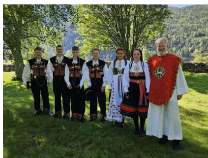
Stefanusborna Konfirmasjon i Hylestad kyrkje

Frå konfirmantbasaren laurdag 1. mars 2024 til inntekt for