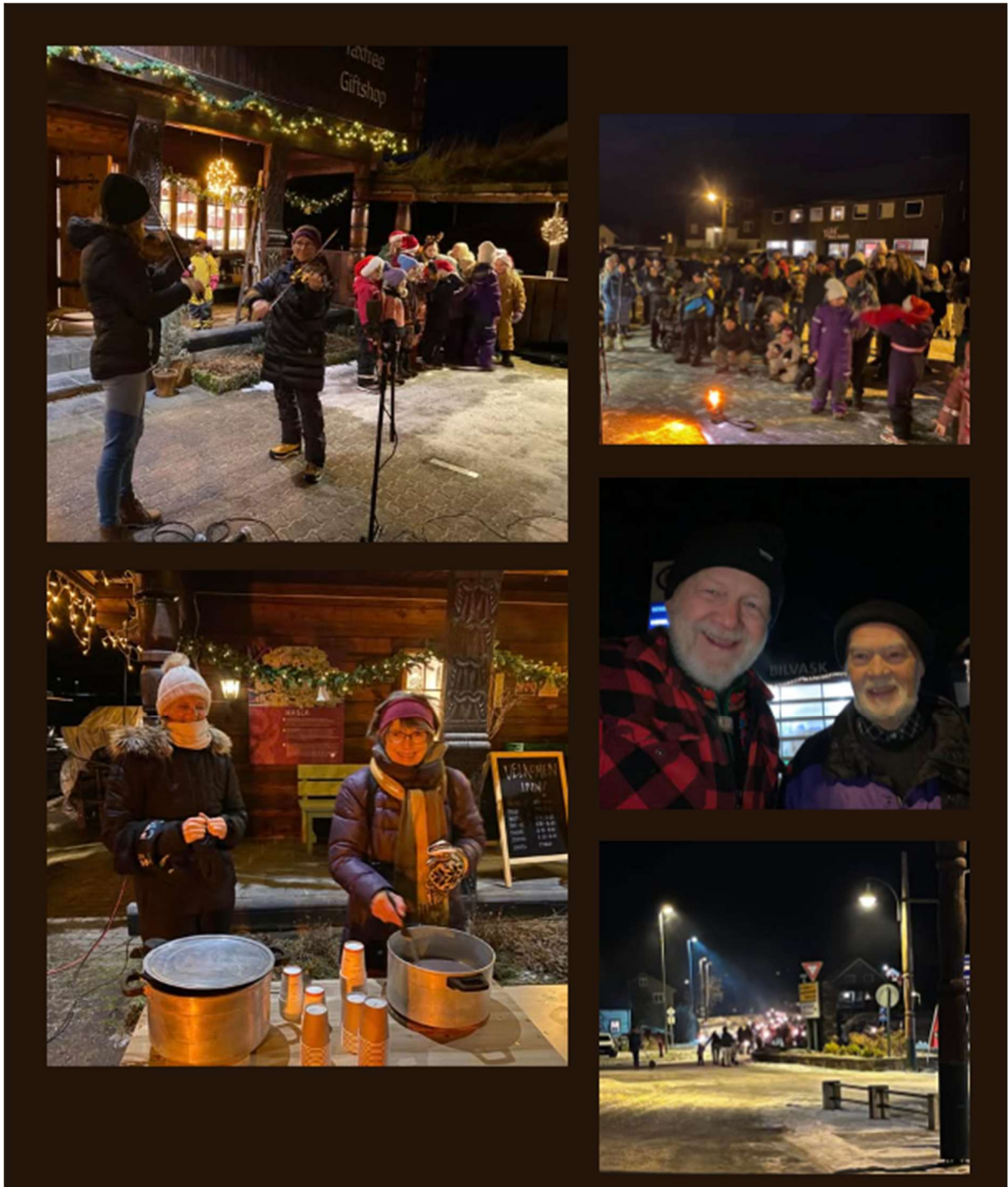
Frå tenning av jolegran i Valle sentrum og fakkeltog til Bygdeheimen, fredag før 1. søndag i advent

I år vart fakkeltoget flytta til fredag før 1. søndag i advent. Det var eit særst godt samarbeid med Valle kommune, Valle sentrumsforening og Valle bygdekvinnelag. Etter evaluering vil ein halde fram med å ha fakkeltoget fredag før 1. søndag i advent neste år.