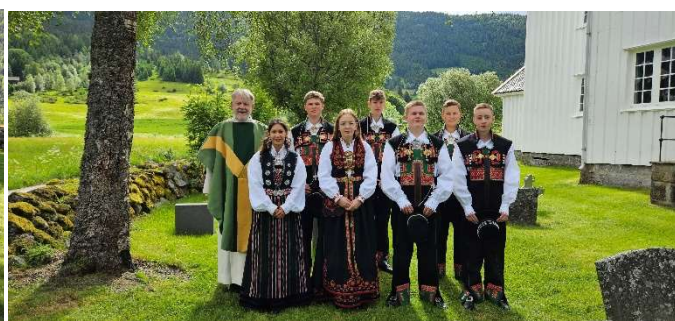
Konfirmasjon i Valle kyrkje

Litt kult at våre gitarar var med i promotering av konfirmantleiren konfACTION